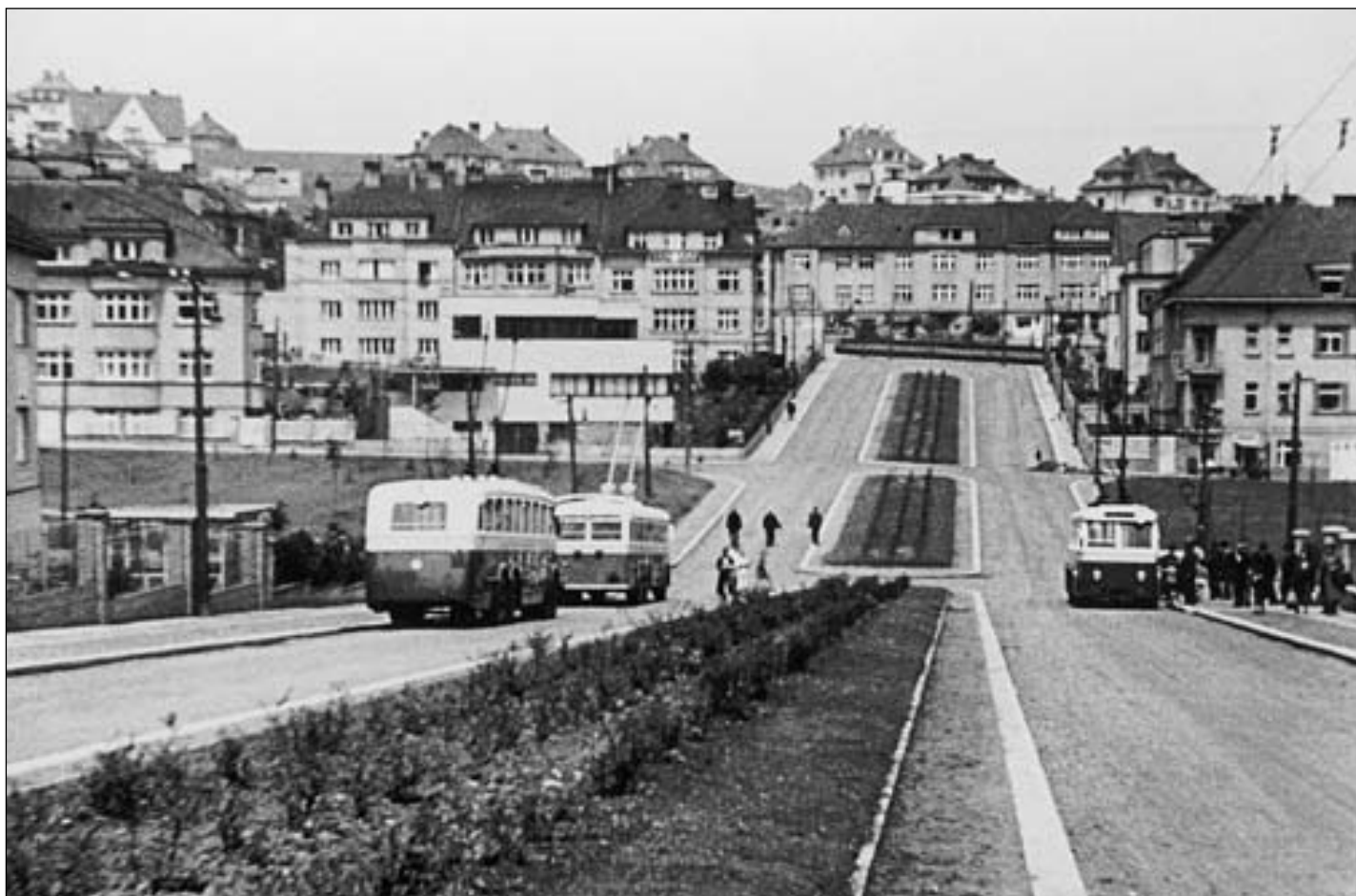
Společný snímek všech prototypů ve Starodějvicke ulici. Zleva stojí vozy Škoda 1Tr číslo 301, Praga TOT číslo 303 a Tatra T 86 číslo 302, léto 1936.