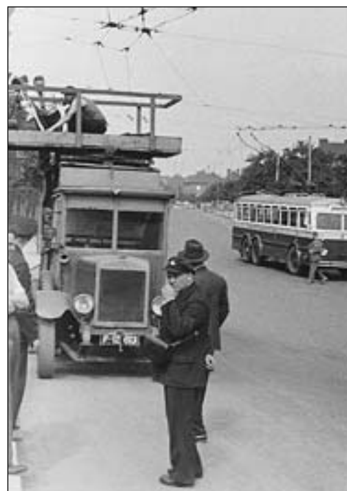
Trolejbus číslo 303 otáčí na vratném trojúhelníku ve střešovické vozovně při zkušebních jízdách v roce 1936. Na pravém snímku stojí stejný vůz společně s trolejovou věží na smyčce pod vozovnou Střešovice.