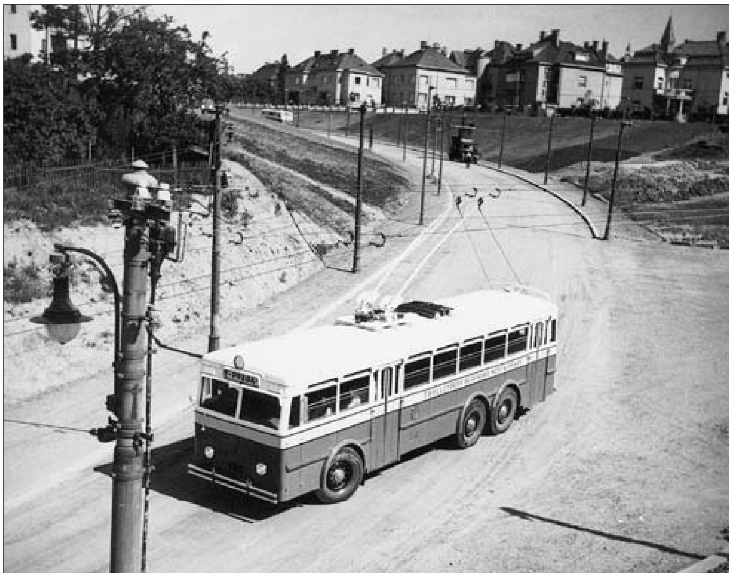
Zkušební jízda vozu číslo 303 v ulici Na Ořechovce, rok 1936.